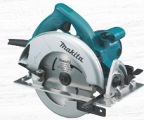
SIERRA CIRCULAR ELÉCTRICA 7-1/4" 1800W