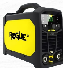
ROGUE ET 205ip 8.8 KG. | 200 A