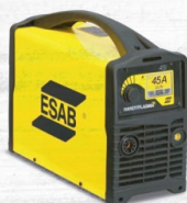
HANDYPLASMA 45 13.5 KG. | 40 A