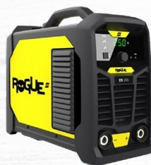
ROGUE ES 305i 12.2 KG. | 250 A