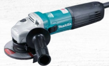
ESMERIL ANGULAR 4-1/2" 1400W