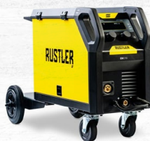
RUSTLER EM 215i 40 KG. | 200 A