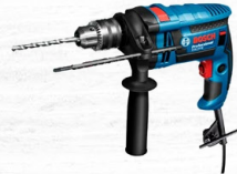
TALADRO PERCUTOR 1/2" 850W 52500GPM GSB 16 RE