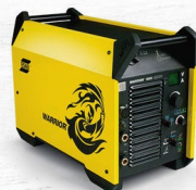
WARRIOR 350 60.8 KG. | 350 A