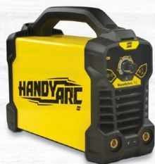
HANDY ARC 162 3.7 KG. | 160 A