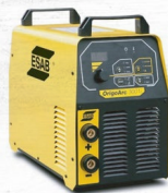
ORIGO ARC 300ii 22.5 KG. | 200 A MONO/TRIFÁSICO