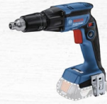
ATORNILLADOR DRYWALL GTB 185-LI SB