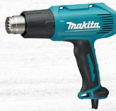
PISTOLA DE CALOR 1,600W / 300 - 500°C