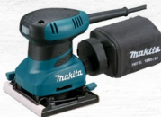
LIJADORA ORBITAL 1/4" 200W 14000 OPM