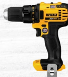
TALADRO ATORNILLADOR 1/2" 20V 70NM BARETOOL