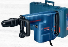
MARTILLO DEMOLEDOR 1500W GSH 11-E