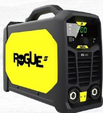
ROGUE ES 245i 8.9 KG. | 200 A