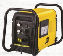
CUTMASTER 60, 80, 100 Y 120