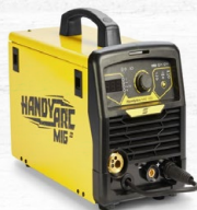
HANDY ARC MIG 160i 10.2 KG. | 160 A