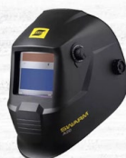
SWARM A10 - A20