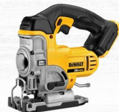
SIERRA CALADORA 1" 20V